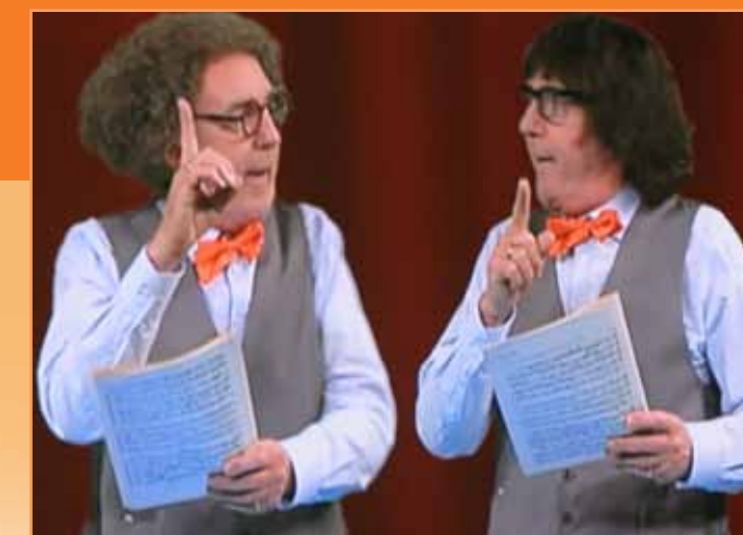
Opletten want de typetjes moeten op elkaar reageren