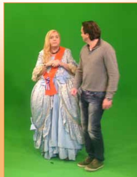
Elk typetje moest apart opgenomen worden voor een speciale groene wand