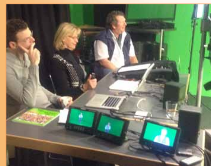
Alles wordt nauwlettend in de gaten gehouden