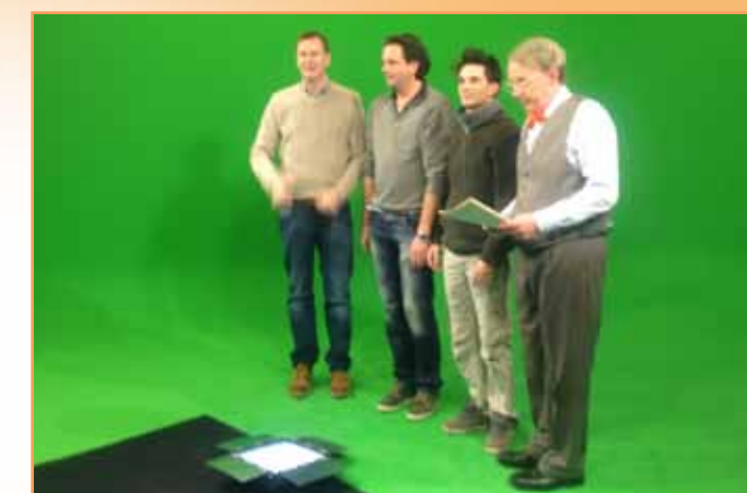
Nog even de tekst doornemen, zodat het straks allemaal klopt