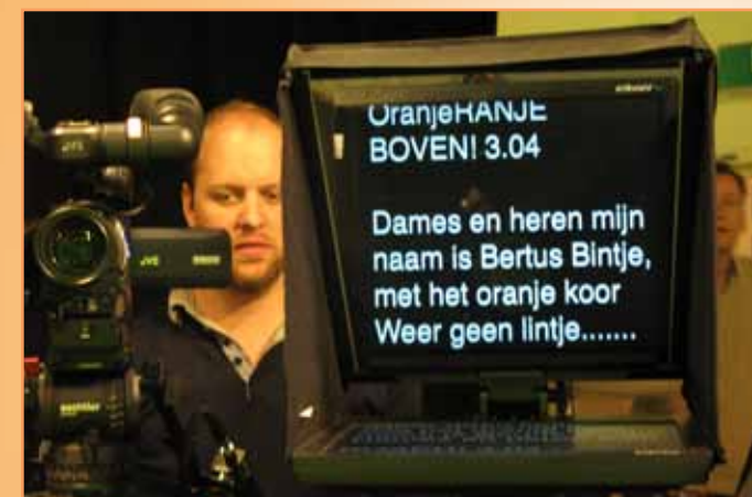
Handige hulpmiddelen om de juiste teksten te zeggen en te zingen