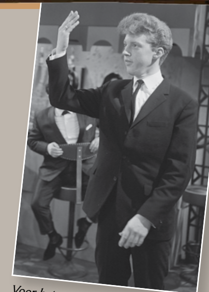
Voor het optreden in de show van Willy & Willeke kreeg ik ook lovende kritieken

Door de jury, bestaande uit Bep Ogterop, Karel Prior, Skip Voogd en Pim Jacobs werd ik als winnaar uitgeroepen. De prijs bestond o.a. uit een optreden in de televisieshow van Willy en Willeke Alberti die onder de titel De zaterdagavondshow werd uitgezonden door de AVRO. En als klap op de vuurpijl ontving ik een aanbieding om voor de AVRO acht tv-shows te maken.