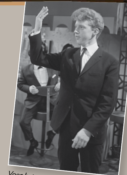
Voor het optreden in de show van Willy & Willeke kreeg ik ook lovende kritieken